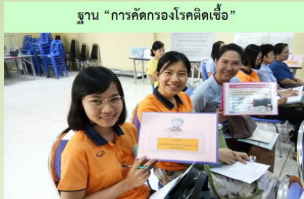
ฐาน “การคัดกรองโรคติดเชื้อ”