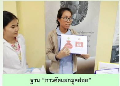
ฐาน “การคัดแยกมูลฝอย”