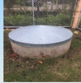
ที่พักขยะอันตราย