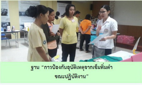
ฐาน “การป้องกันอุบัติเหตุจากเข็มทิ่มตำ ขณะปฏิบัติงาน”