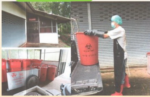
ที่พักมูลฝอยติดเชื้อ