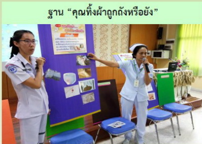
ฐาน “คุมทั้งผ้าก๊อกรองหรือยัง”