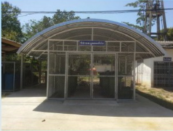
ที่พักขยะทั่วไป