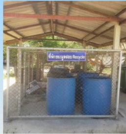
ที่พักขยะรีไซเคิล