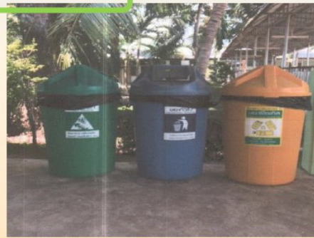
การคัดแยกขยะ